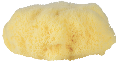
Seda Mediterránea Esponja de mar