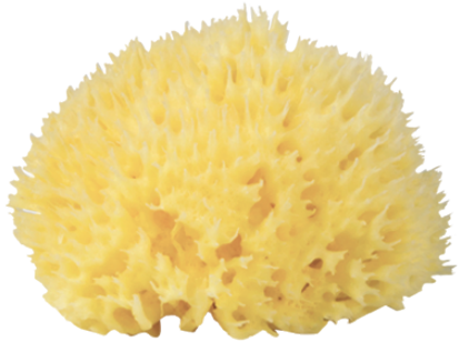
Mediterráneo Esponja de mar de panal